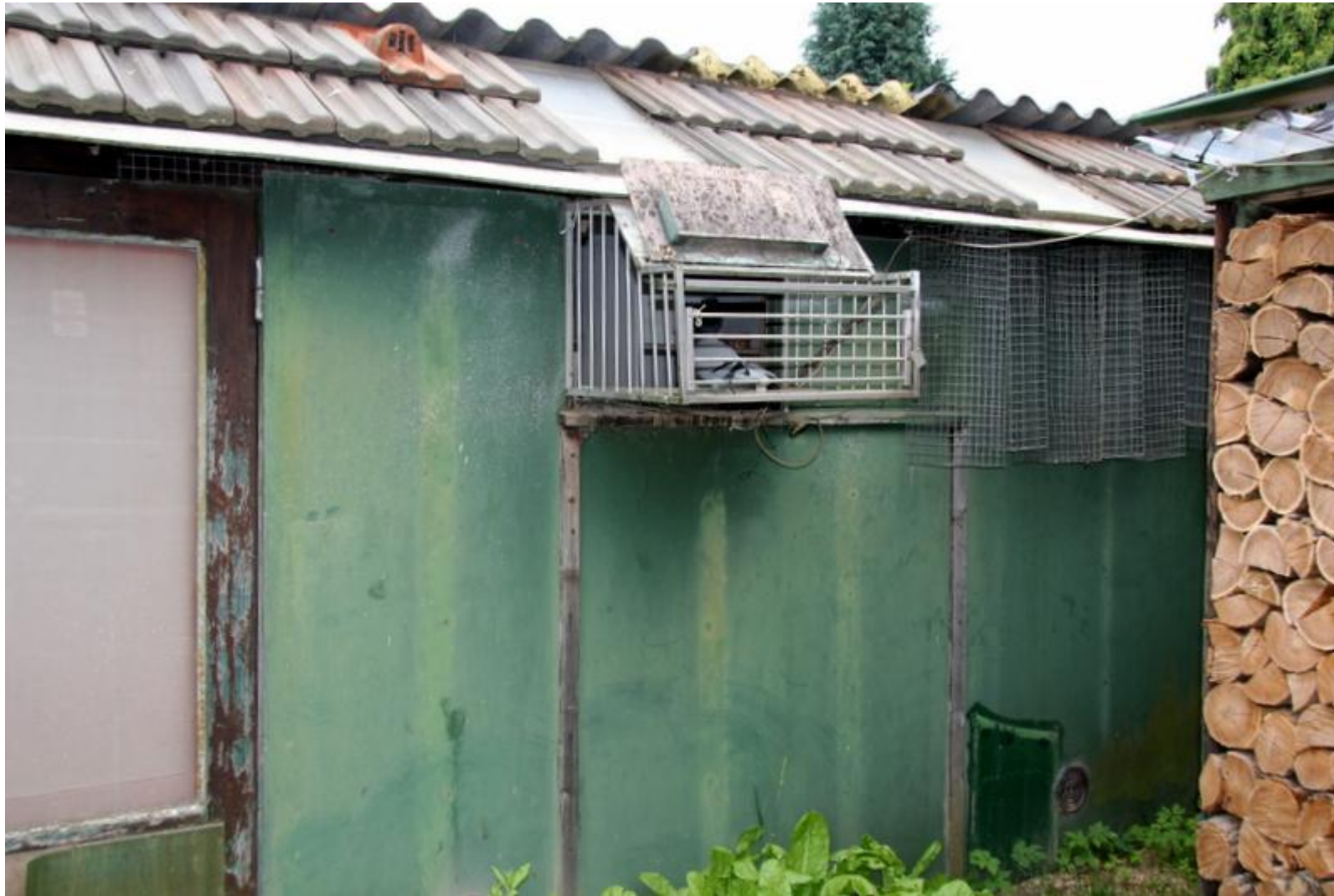
Op dit eenvoudige hokje woont de overwinnaar Bourges.